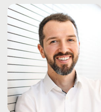
Andreas Gaida Veranstaltungsmanagement